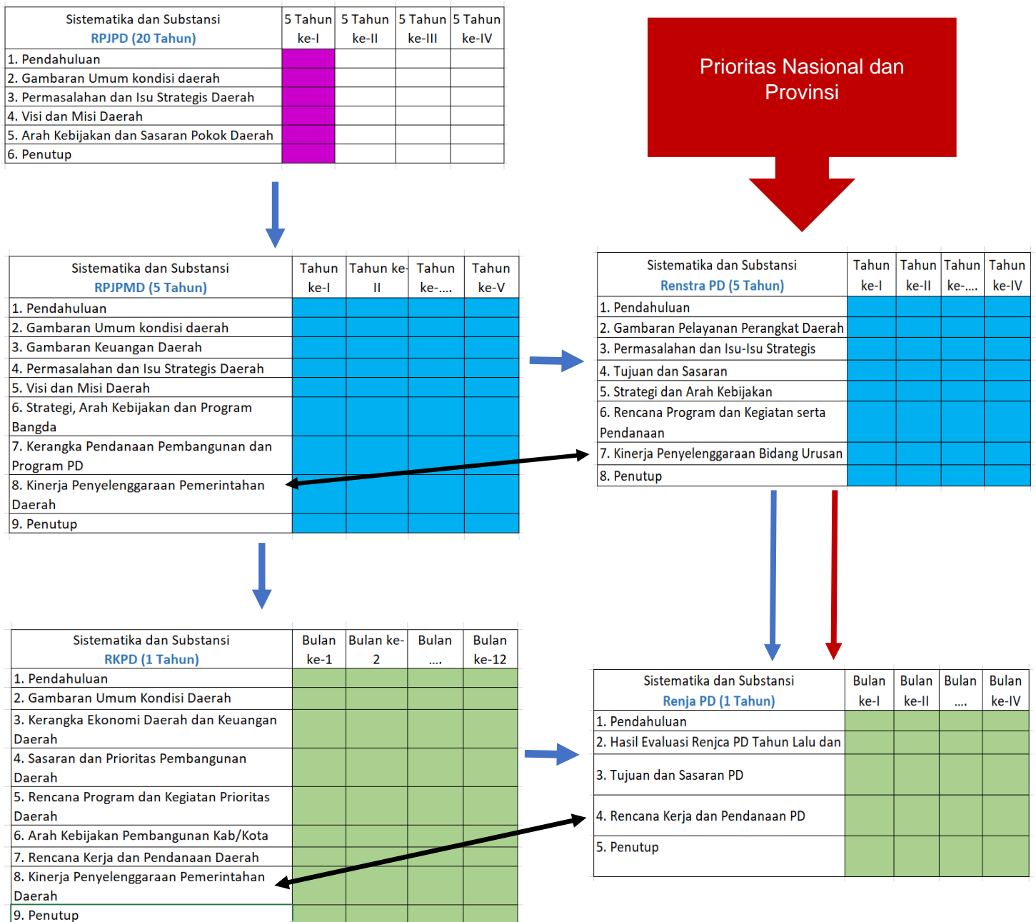
Gambar 1.1 Keterkaitan Dokumen Renja PD dengan Dokumen Perencanaan Pembangunan

Renja PD memuat program, kegiatan, lokasi, dan kelompok sasaran yang disertai indikator kinerja dan pendanaan sesuai dengan tugas dan fungsinya. Tahapan penyusunan Renja PD adalah sebagai berikut: